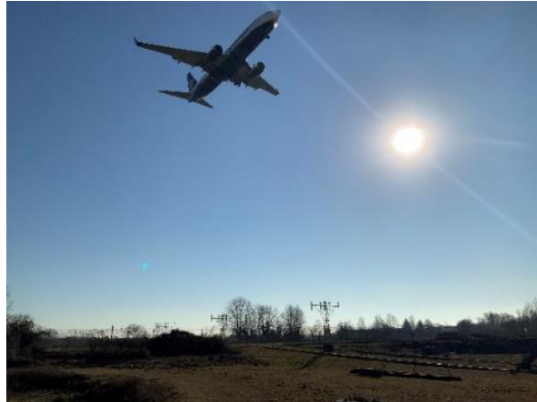
Arrivati in prossimità del "Laghetto delle rane" osserviamo un aereo in fase di atterraggio.