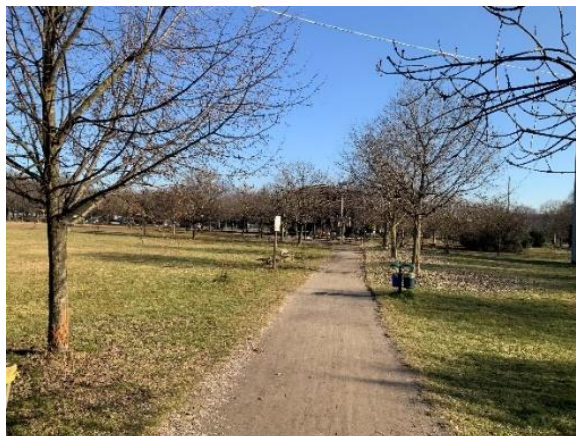
Siamo ormai arrivati al termine della nostra passeggiata e là in fondo vediamo panche e tavoli per il picnic.