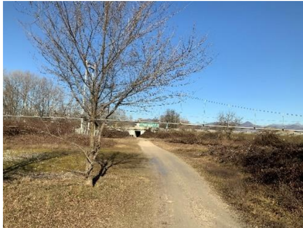
Ritornando verso il punto di partenza raggiungiamo nuovamente la A4.