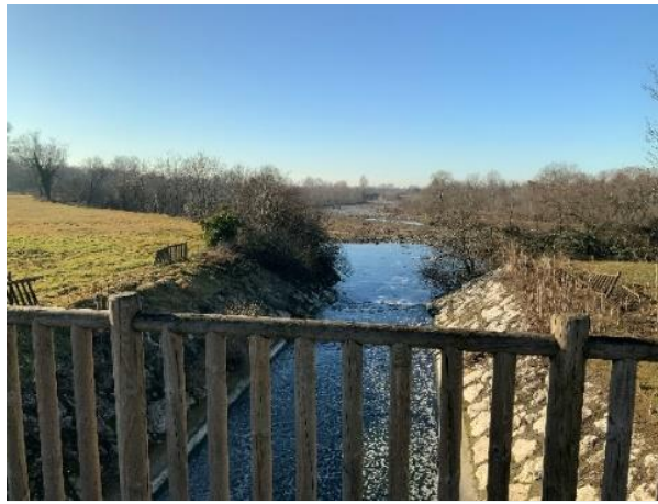
Il canale scolmatore che scarica nel fiume Serio.