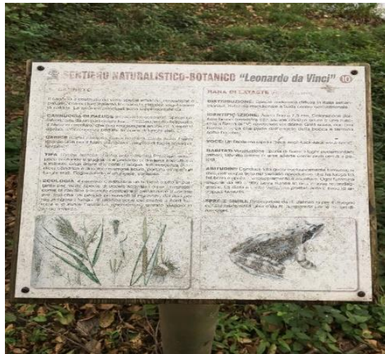
Incontriamo pannelli informativi della flora e della fauna presente.