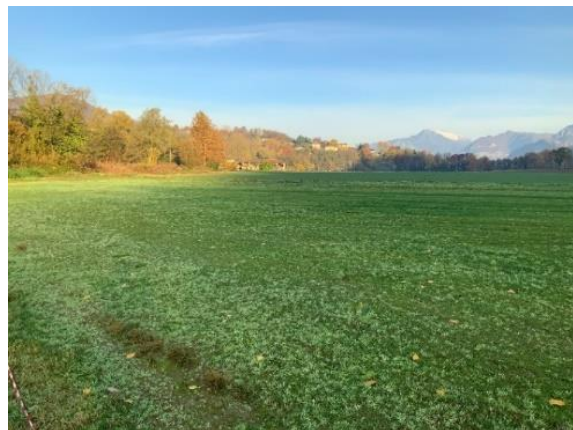
In lontananza, alla fine del prato vediamo una splendida cascina.