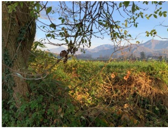
Alla nostra destra ammiriamo in lontananza le montagne sopra Calolziocorte.