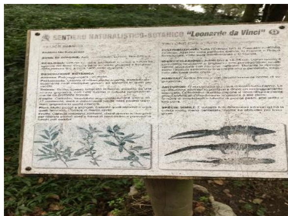
Ci fermiamo a leggere le informazioni presenti sul secondo pannello.