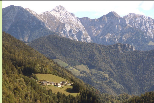
(colle della Maddalena, sullo sfondo Monte Pegherolo)