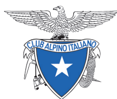
CLUB ALPINO ITALIANO SEZIONE DI BERGAMO "Antonio Locatelli"