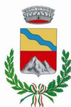
Comune di Carona

e presentata all'atto del ritiro pettorale all'ufficio gara, pena il pagamento della quota iscrizione