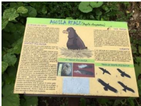
Compaiono anche dei cartelli illustranti la fauna locale.