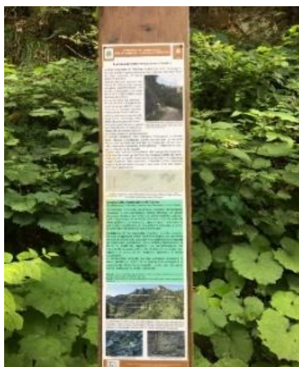
È presente un totem che informa sull'itinerario geologico presente sul percorso.