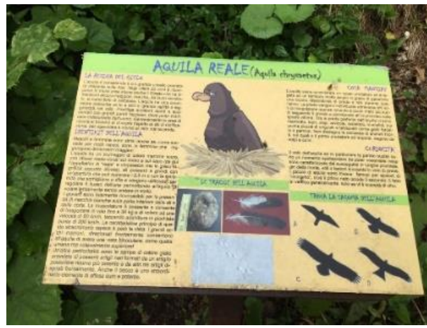
Lungo il percorso sono presenti cartelli didattici sugli animali presenti nella foresta.