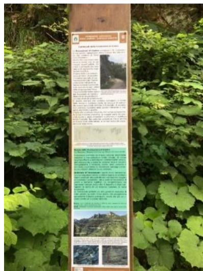
È presente un totem che informa sull'itinerario geologico presente sul percorso.