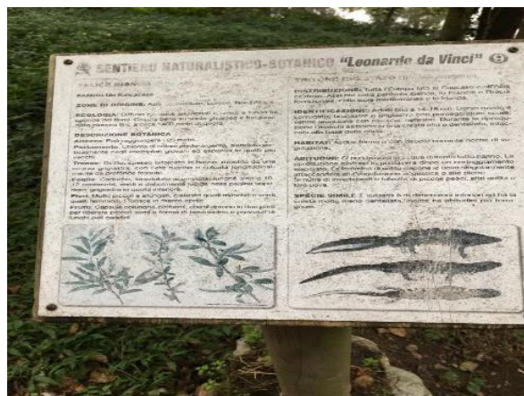
Ci fermiamo a leggere le informazioni presenti sul secondo pannello.