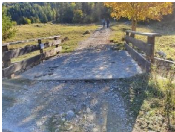
Superiamo il ponticello e proseguiamo a destra.