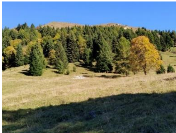
Appreziamo il paesaggio che ci circonda.