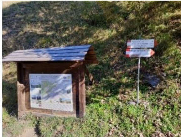
Incontriamo un tabellone indicatore che ci informa sulla direzione da seguire, seguendo il sentiero CAI 428.