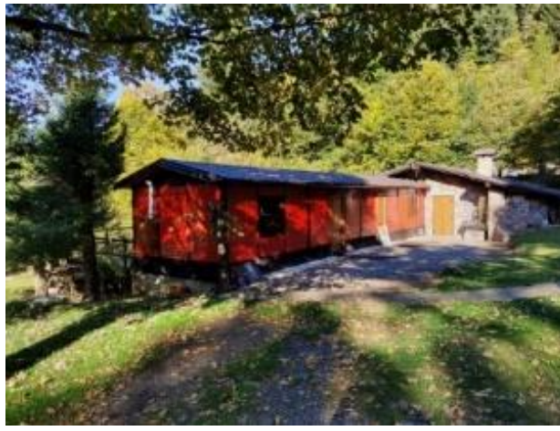
La baita rossa dove parcheggiamo.