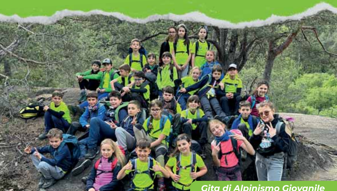
Gita di Alpinismo Giovanile