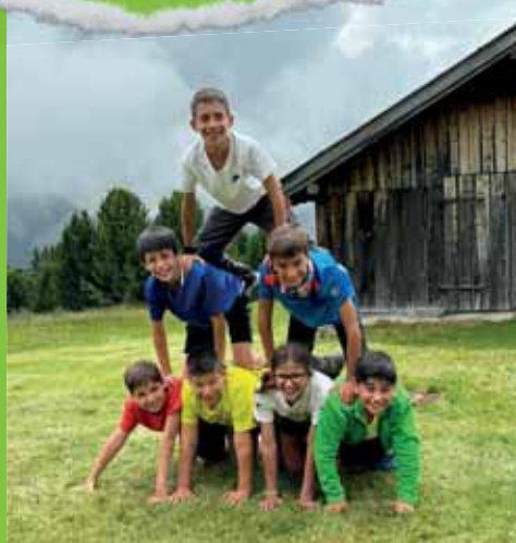
Passo delle Erbe