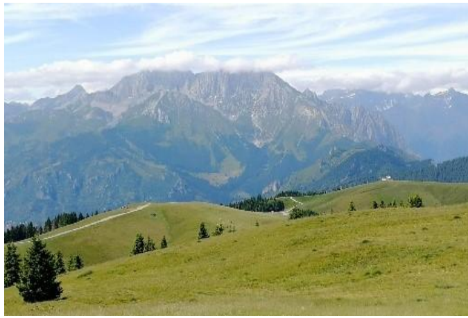
Vista verso la Presolana incappucciata.