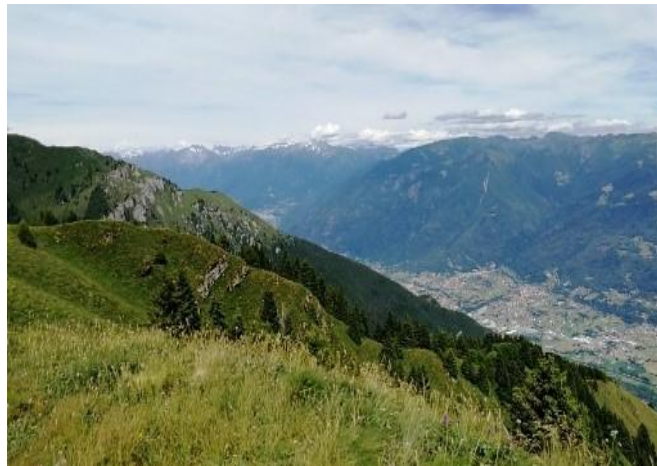
Vista verso la bassa valle.