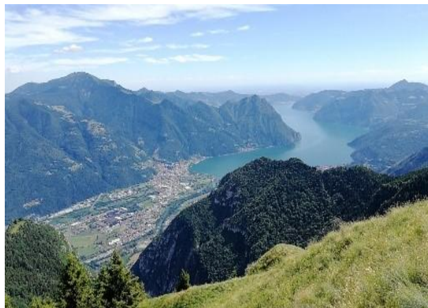
Il lago d'Iseo.