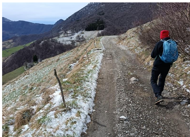
Abbiamo cambiato percorso, con l'intento di realizzare un anello nella nostra escursione.