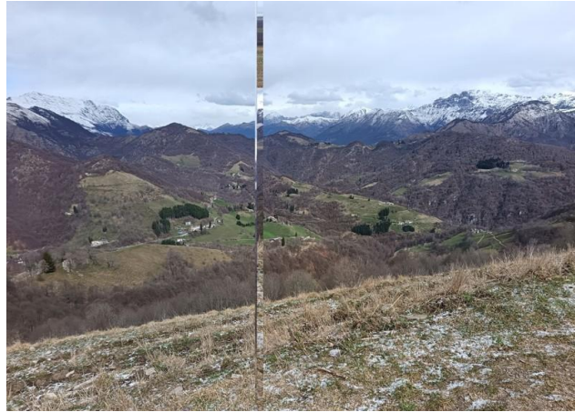
La valle è ricca di prati ed alpeggi.