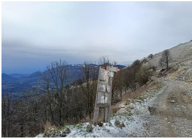
Un cartello ci indica la direzione verso la valle in territorio lecchese.