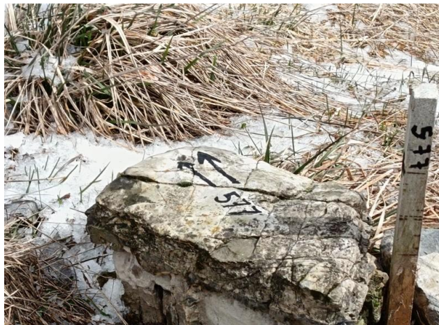
Durante la discesa dal Passo del Palio, al bivio, realizziamo una segnalazione di fortuna indicante il 577.