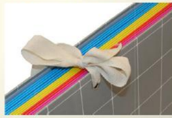
elenco delle autorizzazioni