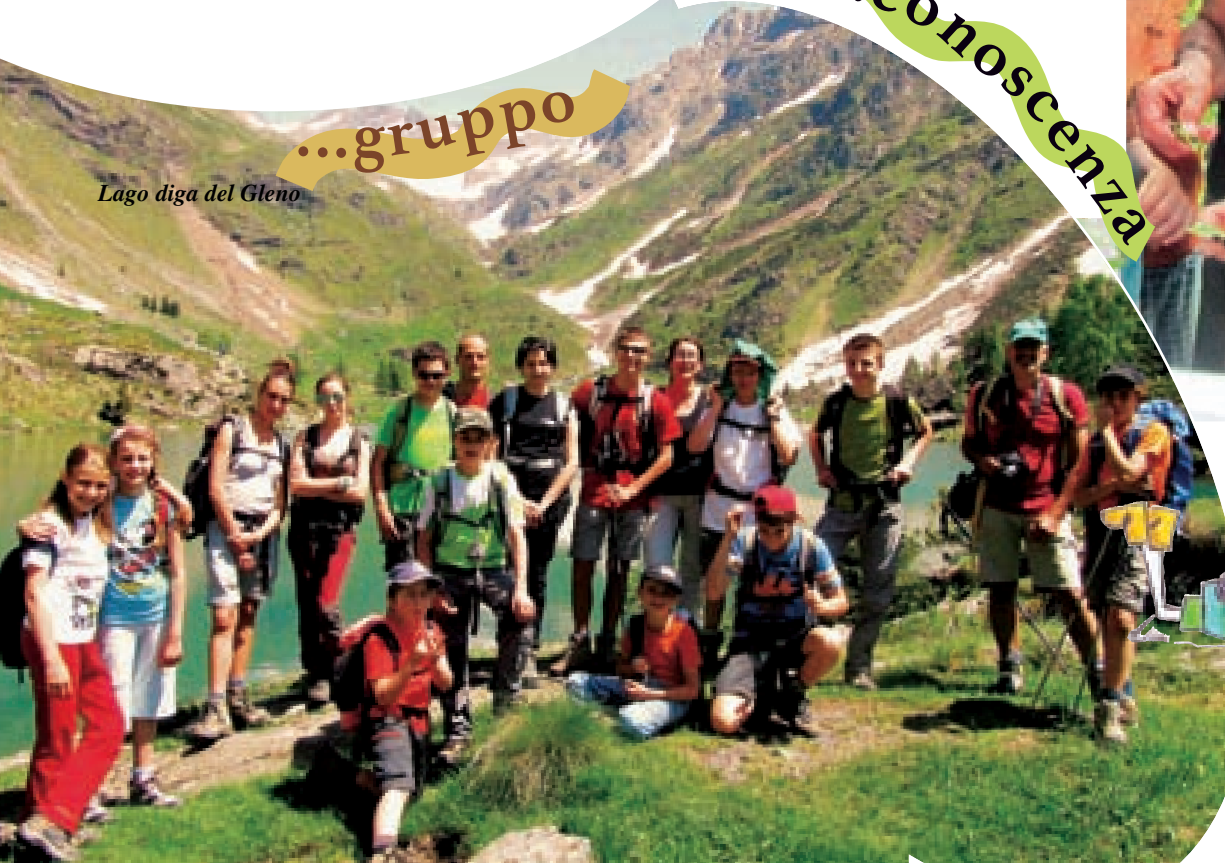
Lago diga del Gleno