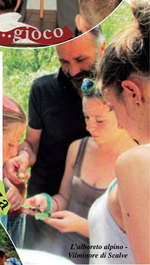
L'alboreto alpino - Vilminore di Scalve